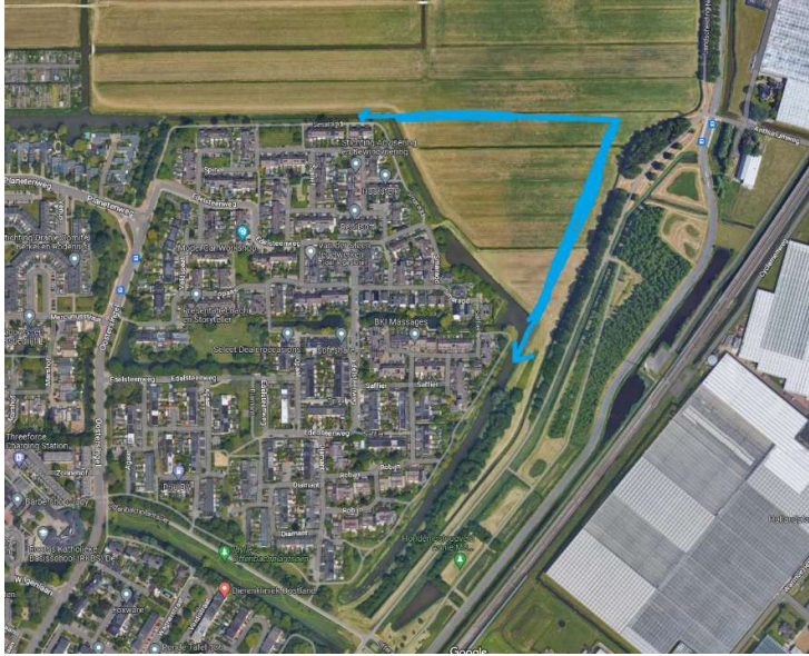
waterstructuur Edelsteenbuurt langs Annie MG-Schmidtpark doorstrekken richting Driehoek Noordpolder